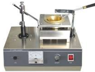
Open Cup Flashpoint Tester