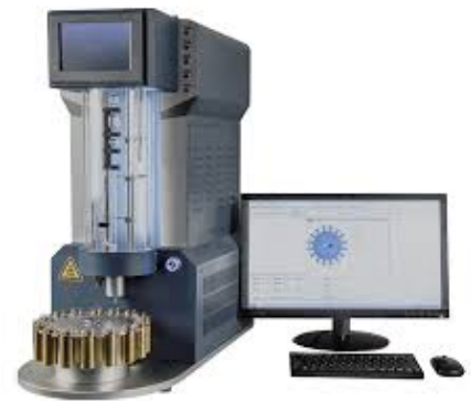
Kinematic Viscosity Tester