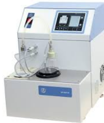
Cold filter plugging point